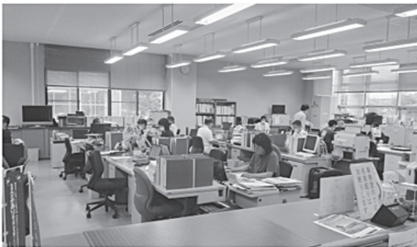
奥出雲町役場の風景